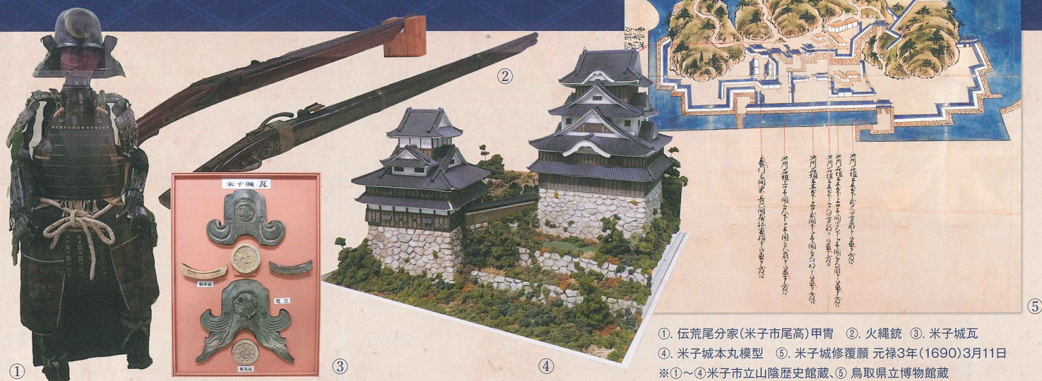
① 伝荒尾分家(米子市尾高)甲冑 ② 火縄銃 ③ 米子城瓦 ④ 米子城丸模型 ⑤ 米子城修履願 元禄3年(1690)3月11日 ※①~④米子市立山陰歴史館蔵、⑤ 鳥取県立博物館蔵

絶景PHOTO・映像・収蔵品など、米子城の魅力あふれる展示やステージイベントを開催!