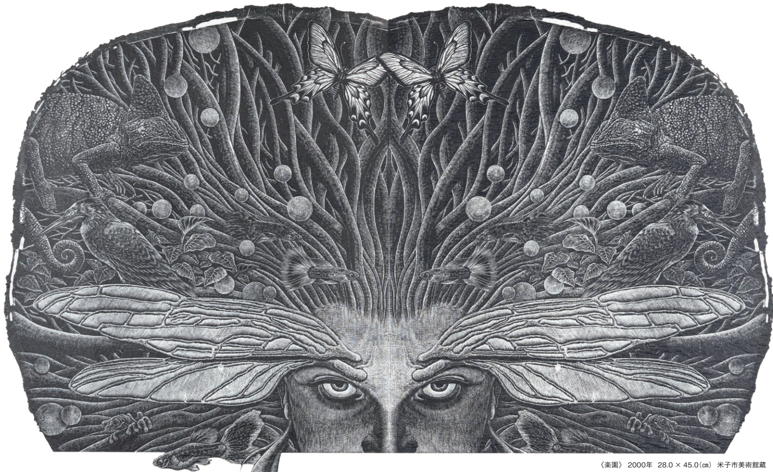
(楽園) 2000年 28.0 × 45.0 (cm) 米子市美術館蔵