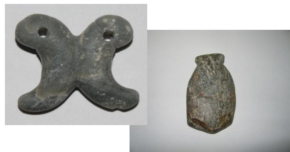
博労町遺跡の石製品