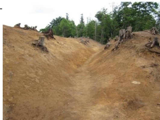
土塁状(塹壕状)遺構

恐らく、調査区の北側に点在している伯楽塚古墳群と同一の古墳が、この調査区内にも存在することを示しているようです。また、土塁の造られた年代については、調査途中のため分かりませんが、中世末の戦国期に築かれたものか、あるいは昭和 20 年に越敷山一帯で行われた本土決戦用の陣地構築、いわゆる「チ号演習」によって造られた塹壕跡の可能性も考えられることから、これから更に調査を進めていきます。(佐伯)