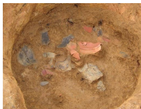
4区 (竪穴住居跡と貯蔵穴)