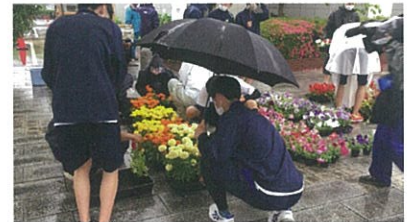
どの花を植えようかな？品定め中・・・。

ここからは、広場を通る皆さんに喜んでいただけるよう、文化ホールスタッフが心を込めて手入れをしていきます。近くにお立ち寄りの際に、皆さんどうぞご覧ください！