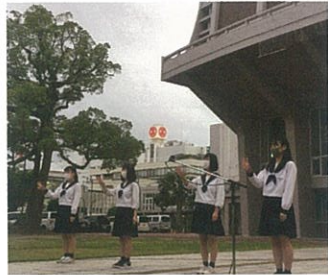
▲高校生のカウントダウン