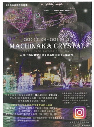
▲米子南高等学校の生徒制作のチラシ

イルミネーション点灯カウントダウン、ダンスパフォーマンス他 米子南高等学校の生徒が企画、進行します。来場時はマスクの着用、3密の回避にご協力をお願いいたします。