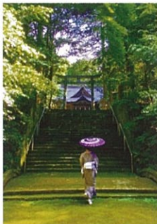
最優秀作品「苔むす境内」

日時 3月3日(木)~3月15日(火) 9:00~22:00 / 毎週水曜休館日 初日は13:00から / 最終日は13:00まで 会場 米子市淀江文化センター ロビー 料金 無料