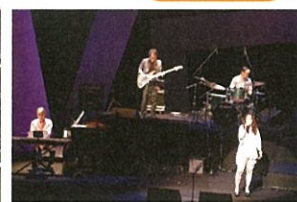
ジェントルソース (ポップミュージック)