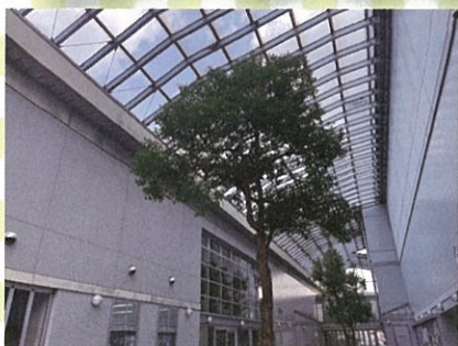
米子市文化ホール

米子市公会堂、米子市文化ホール、米子市淀江文化センターのベストショットを担当者が撮影。3館の日常風景などをお楽しみください。