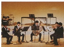
Animato Brass (ブラスアンサンブル)

日時 4月2日（土）開場 / 13:15 開演 / 14:00 会場 米子市淀江文化センター 大ホール 料金 一般 500 円、高校生以下 300 円 【3/3発売】 幼児ひざ上鑑賞無料 プレイガイド 米子市淀江文化センター、米子市公会堂、 米子市児童文化センター、米子市文化ホール 【お問い合わせ】 米子市淀江文化センター ☎ (0859) 39-4050