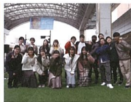
鳥取大学医学部アカペラ サークル Notefull