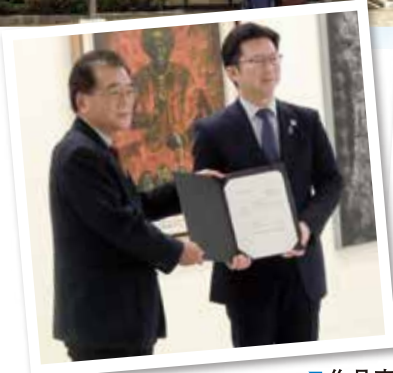
↑ 収蔵作品を米子市へ寄贈