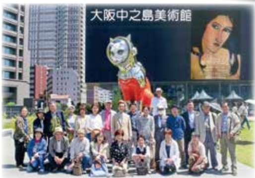
美術館めぐり春の旅行「モディリアーニ特別展」