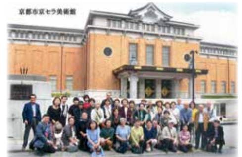
春の旅行「マリナー・ローランサンとモード展」

年会費 ●個人会員：2,000円 ●一般団体会員：10,000円 ●特別団体会員：20,000～50,000円