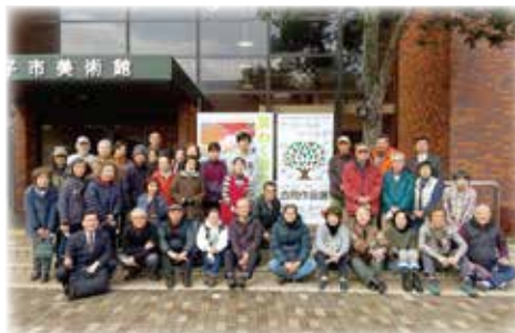
創立35周年合同作品展