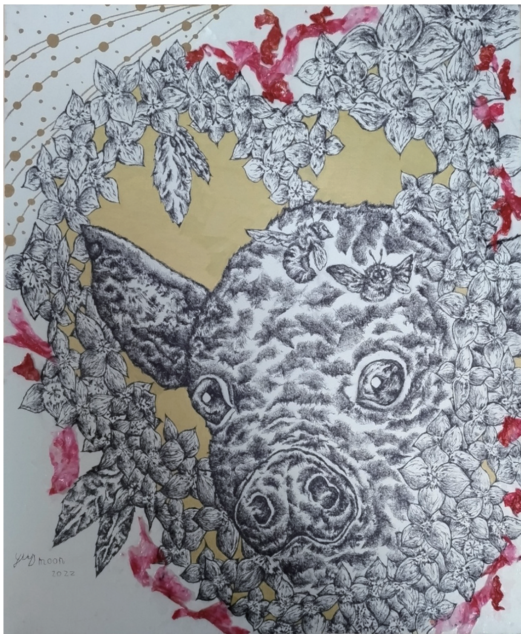
《Pig Heart》 2022年