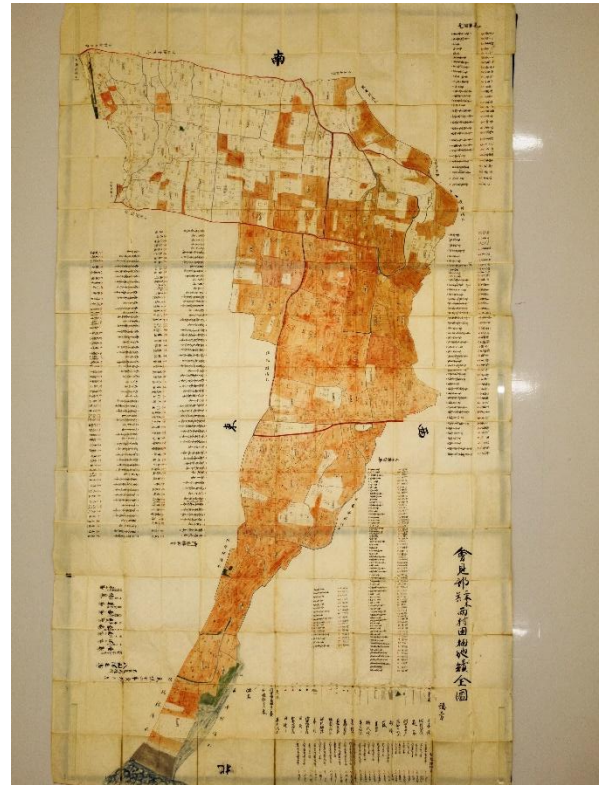
会見郡二本木・箕村田畑地続全図