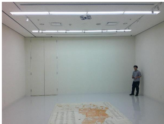
ドローン撮影風景

田畑地続全図は約2.5m×4.3mと大きいため、学芸員がドローンを駆使して資料写真を撮影しました。