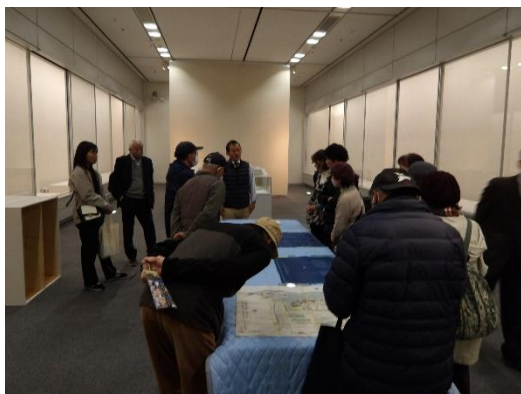
「やまびこ館」バックヤード

新型コロナウイルス拡散の影響もあり、しばらく中止していました米子市歴史館友の会の研修会を11月22日に開催しました。研修先は鳥取市の「やまびこ館」、「青谷かみじち史跡公園展示館」、倉吉市の「小川氏庭園」の三か所です。各施設では、学芸員や担当者から解説を受け大変参考になりました。「やまびこ館」ではバックヤードや米子関係資料を見せていただき、また、小川氏庭園では紅葉する庭園と茶室での抹茶を堪能しました。