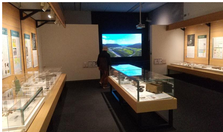
「やまびこ館」展示室

歴史館友の会の研修に参加しました。一路鳥取を目指し鳥取市歴史博物館「やまびこ館」に到着。学芸員の丁寧な解説で施設を見て回りました。2000年(平成12)に開館した完全空調のやまびこ館と1984年(昭和59)に米子市役所旧館を再利用し、ストーブを焚く我が山陰歴史館の施設との落差に愕然としながら、新しがり屋の米子の気風と伝統を重んじる鳥取の気風との歴史文化の違いなのかなと思います、ため息が出ました。