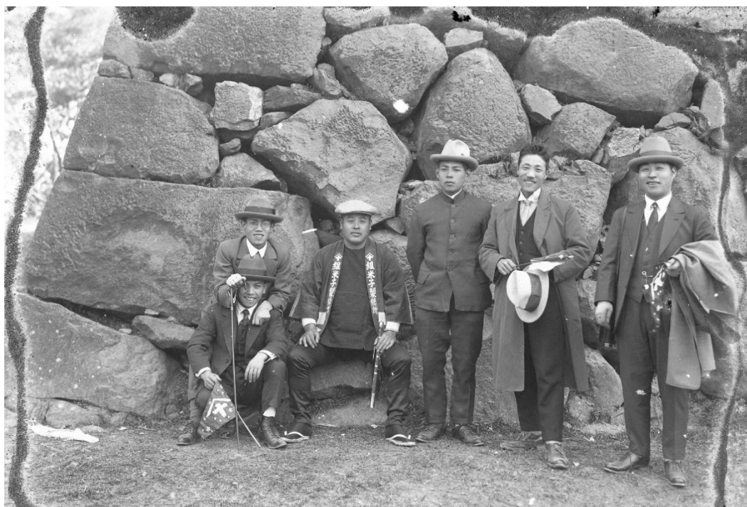
石垣前の記念写真

タムラ写真館の干村廣三郎氏が戦前に撮影されたガラス乾板写真を中心に、関連資料を展示し、郷土の戦前の暮らしや風景を振り返ります。