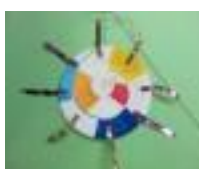
紙皿のかざぐるま